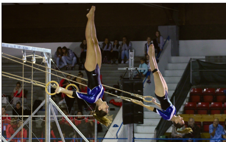
Vevey Jeunes Patriotes, 17 e au sol et 20 e aux anneaux balançants.