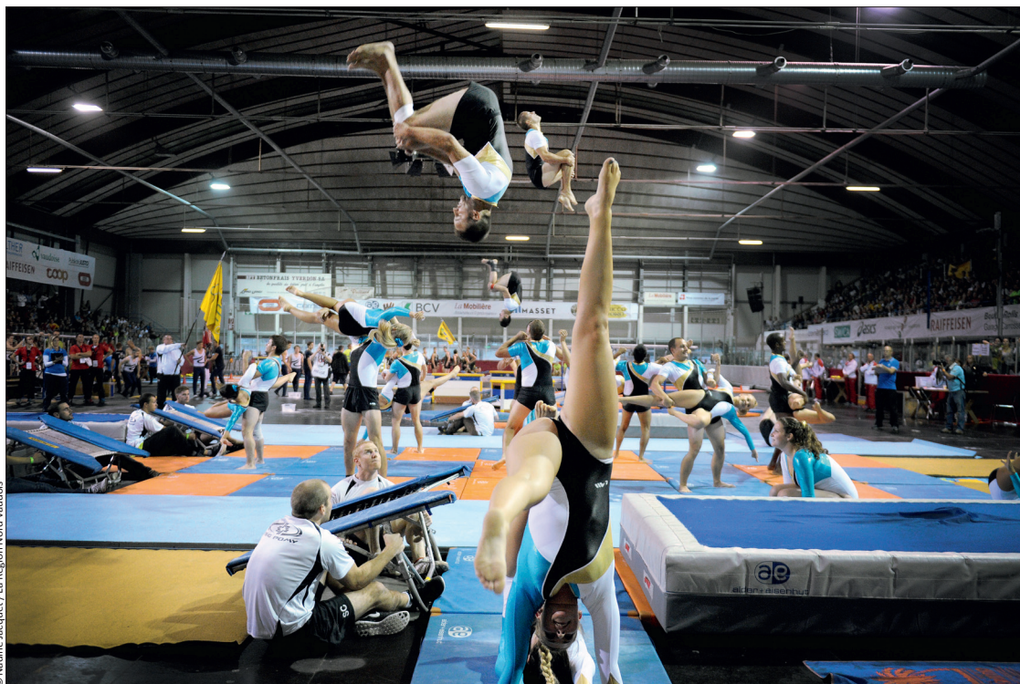
Pomy a remporté la médaille d'or à la combinaison d'engins.

Brütten (ZH) en gymnastique 35+, Teufen (AR) en gymnastique sur scène et Luzern-Bürger (LU) aux sauts ont conservé leurs titres acquis l'an dernier. Mels (SG) aux barres parallèles et au sol, Wettlingen (AG) aux anneaux, Pomy (VD) en combinaison d'engins ainsi que Vilters (SG) en gymnastique avec engins à main ont regagné la médaille d'or qu'ils avaient perdue en 2014. De nouveaux champions ont été sacrés aux barres asymétriques : Vordemwald (AG), à la barre fixe : Rohrdorf (AG) et en gymnastique petite surface : Langendorf (SO).