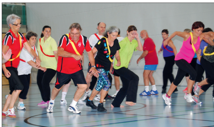
Les participants du cours cantonal 2015 ont testé avec entrain les nouveaux jeux et nouvelles activités proposés par les techniciens.