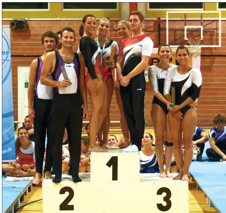
Podium du classement par équipes Actifs-Actives : 1. Yverdon Amis-Gymnastes ; 2. Vevey-Ancienne ; 3. Vevey Jeunes-Patriotes.

Texte : J.-F. Martin