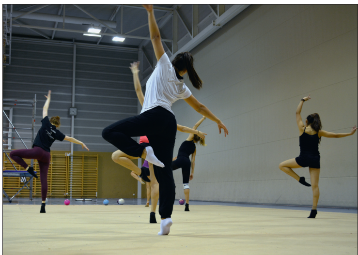
Le groupe Team Vaud qui participera au Gala de la Fédération internationale de gymnastique (FIG) lors de la Gymnaestrada 2015 à Helsinki.