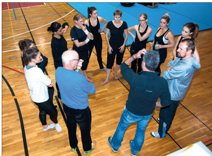
Inspection de la FSG - Débriefing entre la FSG et les entraîneurs.

Suite à cette soirée, les gymnastes ont bien entendu retrouvé les salles de gym du canton de Vaud pour des entraînements intensifs. C'est pas tout ça, mais la FSG venait inspecter le groupe le 30 novembre. Inspection qui s'est très bien déroulée par ailleurs. La dernière ligne droite est maintenant entamée, nous menant dans un premier temps à la Gymnastrada Première qui se déroulera à Neuchâtel le 25 avril 2015. La billetterie est déjà ouverte mais n'oubliez pas que le groupe, en compagnie des deux autres groupes vaudois, se produira également la veille du départ à Helsinki lors du Gala des groupes vaudois, le 27 juin à Morges.