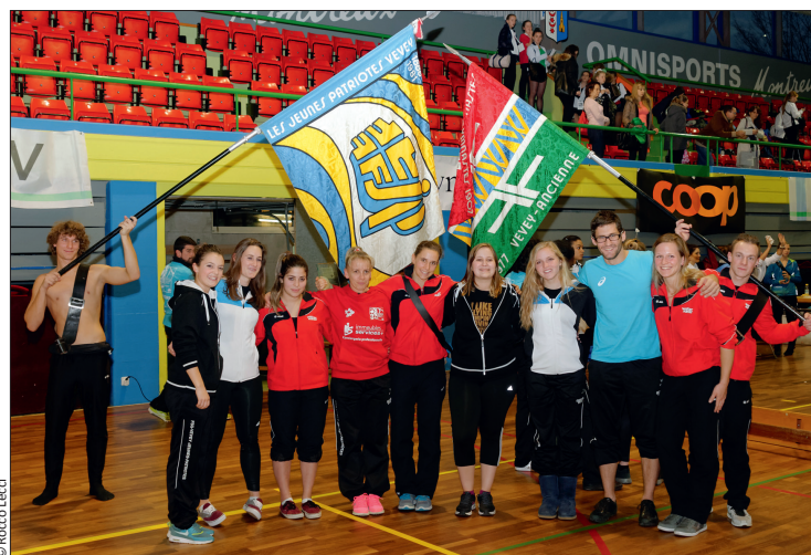
Des coaches veveysans comblés.