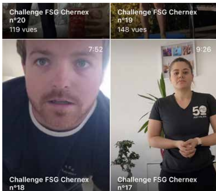
Les challenges sur la page instagram de la FSG Chernex