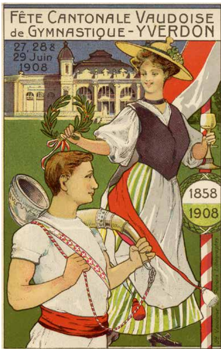
1908: Une des cartes postales

Banquet à midi, avec partie officielle, neuf discours. Fin des concours puis remise des prix, à 19h et cortège devant une «énorme assistance.» La fête du dimanche soir dure jusqu'après minuit. Le chroniqueur du Journal d'Yverdon relève que «l'entrain était général et la gaieté n'a été troublée par aucun désordre.» Il donne